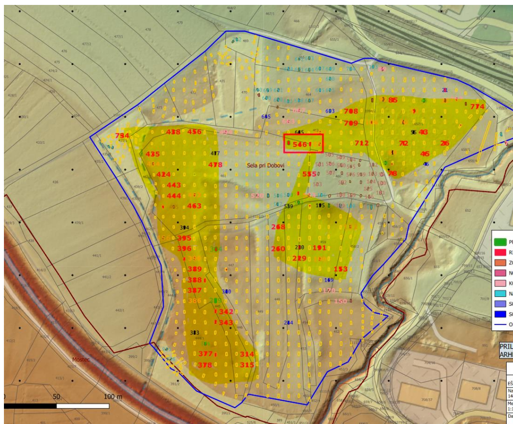
Slika 1-3. Širitev obrtne cone Dobova območja "Z (Z0- Z14)" na parc. št. 452/4, 450/3, 450/1, 657/2, 799/4, 659/4, 829/7, 1111/6, 452/3, 1111/4, 440/3, 444/2, 444/1, 445, 446, 452/1, 453, 454, 815/2, 447, 448, 449, 458/2, 458/1, 457, 455/1, 455/3, 456/1, 455/3, 456/1, 452/2, 1111/7, 829/9, 829/2, 656/1, 655, 800/17, 831/7, 1111/12, 658/4, 831/5, 831/4, 652, 651, 1113/2, 1113/5, 658/1, 657/1, 460, 1094/2, 463, 464, 461, 462/1, 439/4, 439/2, 435/3, 435/1, 473, 472, 471, 470, 465 in 469; skupne površine 58, 706 m 2, brez novogradnja cestne ureditve vodnogospodarske ureditve, mostu čez Negot ter pripadajoča ureditev komunalne infrastrukture, ki je predmet posebnih KV pogojev (dopolnitve) št. 35105-0681/2021/14 z dne 09. 10. 2024 na vseh 9315 m 2 ocenjene velikosti.